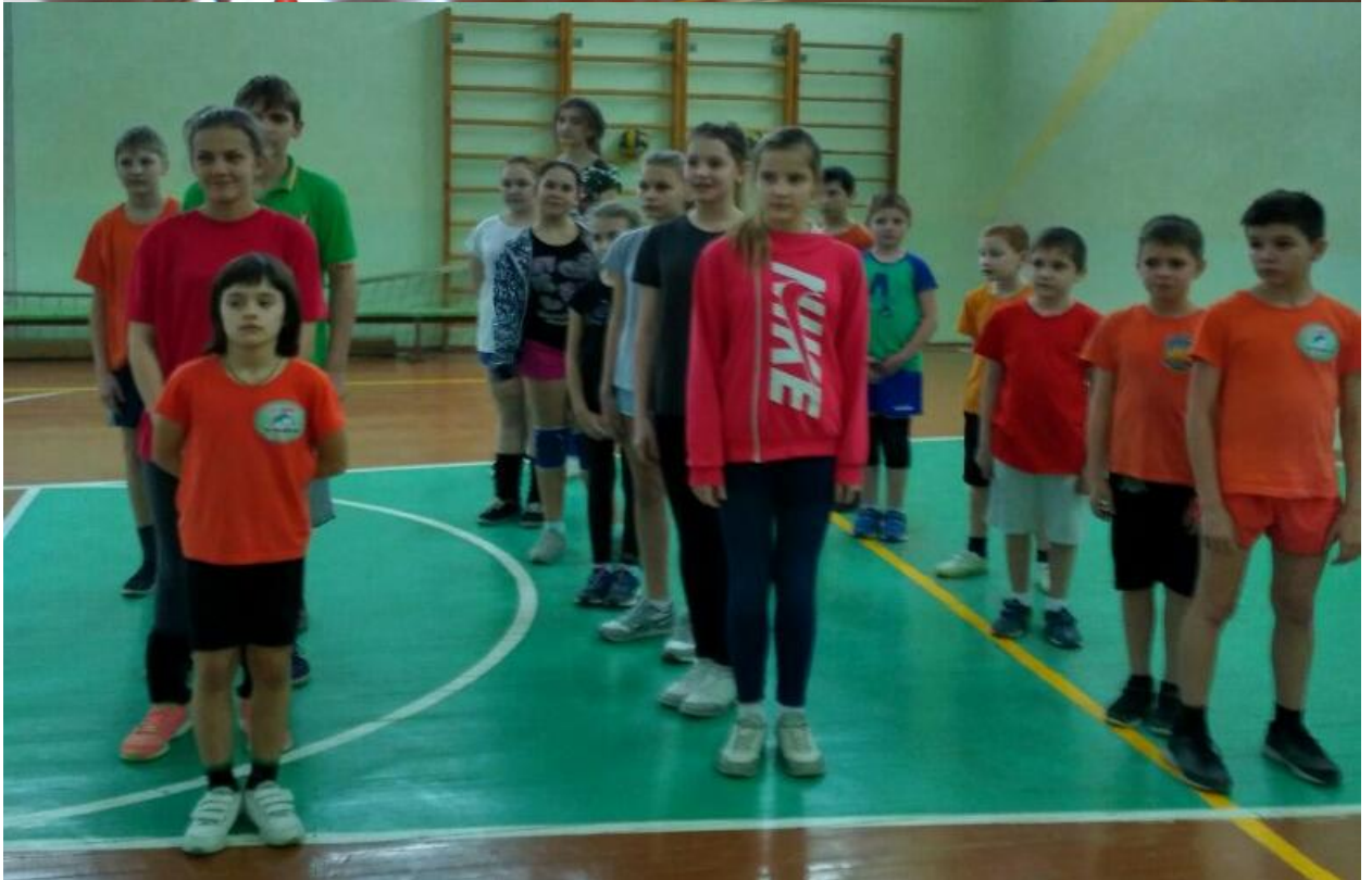
Месячник оборонно - массовой и военно-патриотической работы под девизом "Святое дело - Родине служить!" в МБУ ДО ДЮСШ 1 города Белореченска МО Белоречинский район. Открытие .